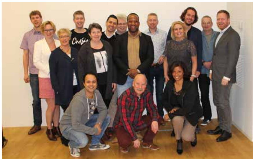
Leden OR Flex geïnstalleerd april 2016 (van links naar rechts)